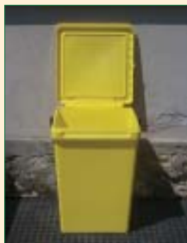
Contenitore giallo per carta e cartone