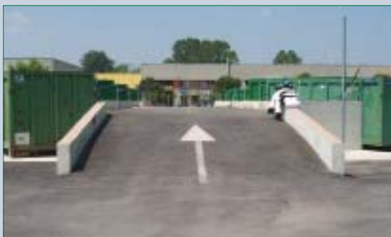
Due immagini del Cerd di Roncade