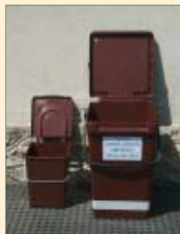
Contenitore marrone per rifiuti umidi