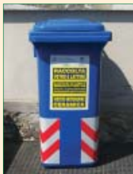
Contenitore azzurro per vetro, lattine, plastica