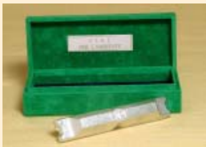
Premio "Comune Riciclone" 2001