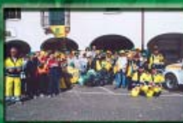
Successo delle iniziative "Puliamo il mondo"