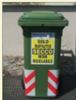
Contenitore verde per il secco non riciclabile