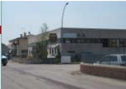
Le indicazioni poste in zona industriale a Roncade