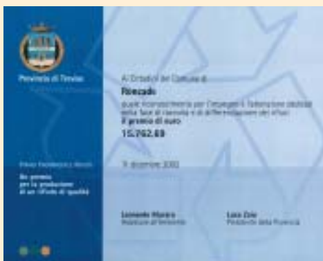
Premio "Provincia di Treviso" 2002 Qualità della raccolta differenziata