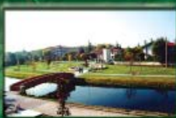
L'importanza delle aree verdi. La scelta coraggiosa del Parco del Musestre