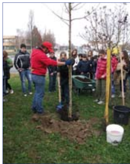
la scolaresca con una lezione pratica di scienze naturali.

Infine, i ragazzi di prima sono stati coinvolti in un'esperienza di piantumazione di cinque piantine (una per ogni classe coinvolta) in cui lo slogan "+ Alberi - CO2" sintetizza bene lo spirito dell'iniziativa. Alcuni degli alunni hanno collaborato materialmente per preparare il terreno e piantare gli alberelli che poi sono stati affidati alle loro cure, non resta che attendere la primavera per scoprire il frutto del loro lavoro. Tale esperienza è stata possibile grazie alla collaborazione del Dott. Federico Ceron, che ha fornito le piante necessarie e intrattenuto