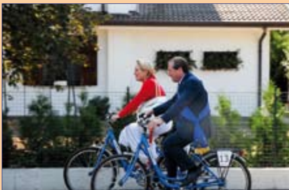
L'onorevole Simonetta Rubinato e il presidente della provincia Leonardo Muraro

Il percorso, della lunghezza di oltre 2,5 km, è costato complessivamente un milione e 820 mila euro, di cui un milione sostenuti dall'Azienda Sile Piave per la realizzazione della fognatura, 750 mila dal Comune di Roncade per la nuova pista, mentre la Provincia ha concesso un contributo di 40 mila euro per il guard-rail. Infine la ditta Forel Spa ha realizzato una minirotafora del costo di 30 mila euro.