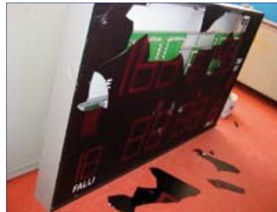
Il tabellone elettronico danneggiato